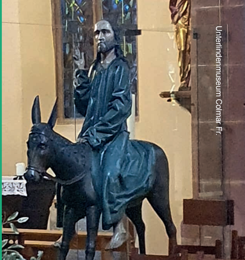
Unterindemuseum Colmar Fr.

Wat betekent navolging van die Mens en zijn volgelingen anno nu voor ons en voor DEZINNEN? Daar gaan we dit voorjaar op verschillende manieren mee bezig. Even geen vol programma maar tijd en ruimte om het hier over te gaan hebben.